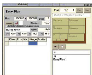
割付ソフト イージープラン