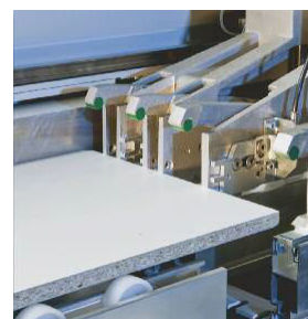
ダブルフィンガー材料クランプ